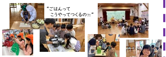
“みんなと食べる朝ごはんは おいしい♡”

はじめてのお泊り保育に みんな ドキドキ!ワクワク♪ お買い物に行って、カレーを作って、先生たちと遊んで、 花火を見て、みんなと一緒に寝て・・・起きたらラジオ体操!