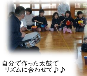
自分で作った太鼓でリズムに合わせて♪