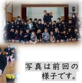
写真は前回の様子です。